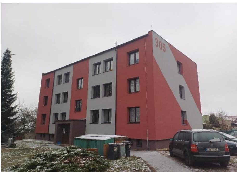
2024 – Červená Řečice č.p. 305 – oprava fasády, lodžie