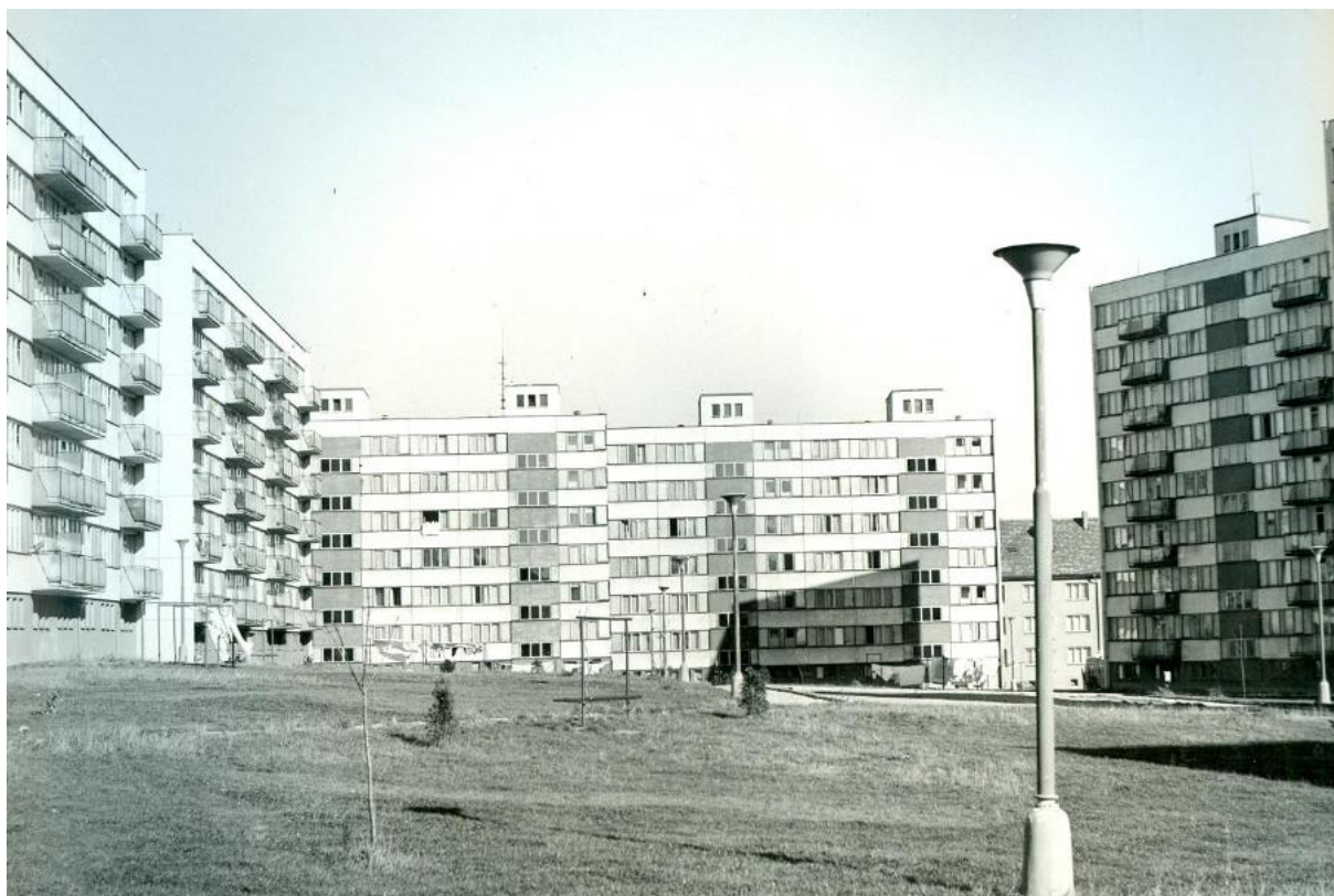
1974 – STARÉ SÍDLIŠTĚ

V roce 1973 proběhlo i další sloučení družstev. Do Stavebního bytového družstva Družba se sloučila následující družstva: SBD Občanů 1, SBD Občanů 2, SBD pracovníků Agrostroj Pelhřimov, SBD pracovníků Spojených kartáčoven Pelhřimov, SBD Pracující mládeže Pelhřimov.