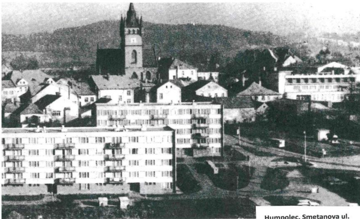
Humpolec, Smetanova ul.

Původní fond družstevních bytů je postupně na základě zákona o převodu bytů do vlastnictví rozdělován na byty v osobním vlastnictví a byty ve vlastnictví SBD. Pod správou SBD Pelhřimov i nadále, ve většině případů, byty vlastníků zůstávají. V Humpolci je spravováno celkem cca 1100 bytů.