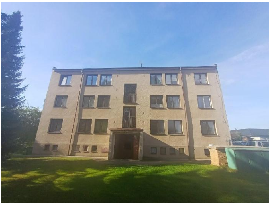
2024 – Červená Řečice č.p. 305 – původní stav