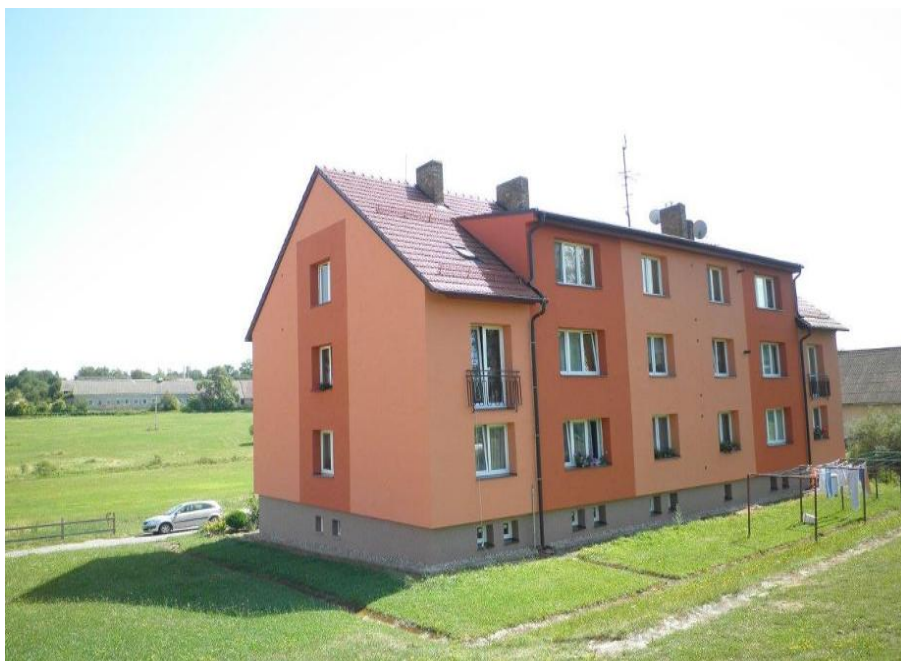
2013 – Vyskytná č.p. 142 – zateplení fasády