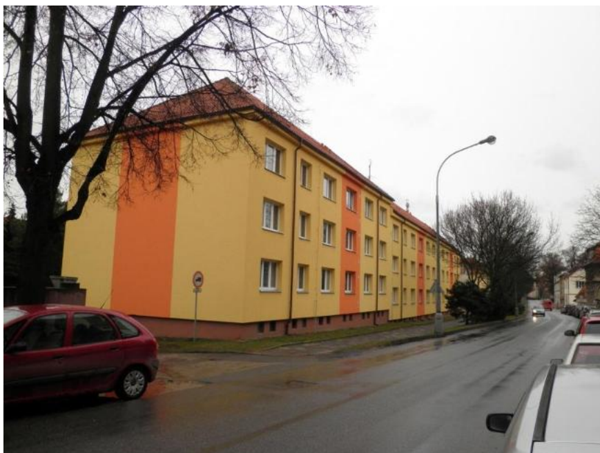
2011 - Revitalizace Pelhřimov, Třída Legií č.p.984-6