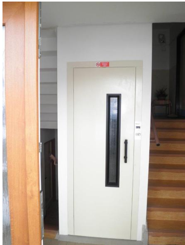
2013 - Pelhřimov, Husova 1098-9

Od roku 2002 se ještě ve větším rozsahu rozjela výměna oken a zateplování budov. Dále masivně probíhala výměna závěsných balkonů, které byly ve velmi špatném stavu, za přistavěné betonové lodžie. První přistavěné lodžie byly v Pacově a postupně i u mnoha domů v Pelhřimově, Počátkách, Humpolci a Žirovnici. Celkem bylo přistavěno víc než tisíc lodžii.