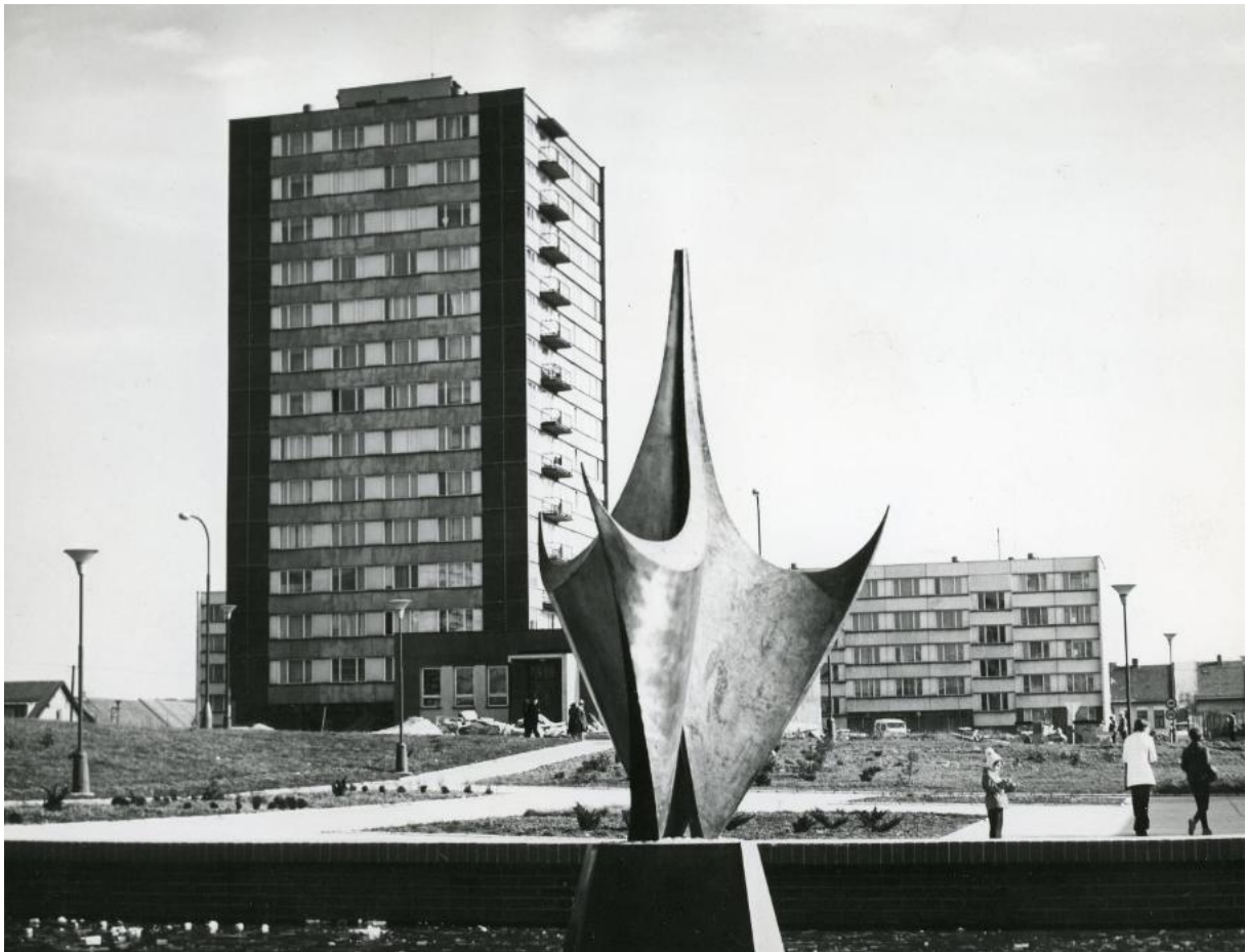
1976 – PRAŽSKÁ ULICE – VĚŽÁK