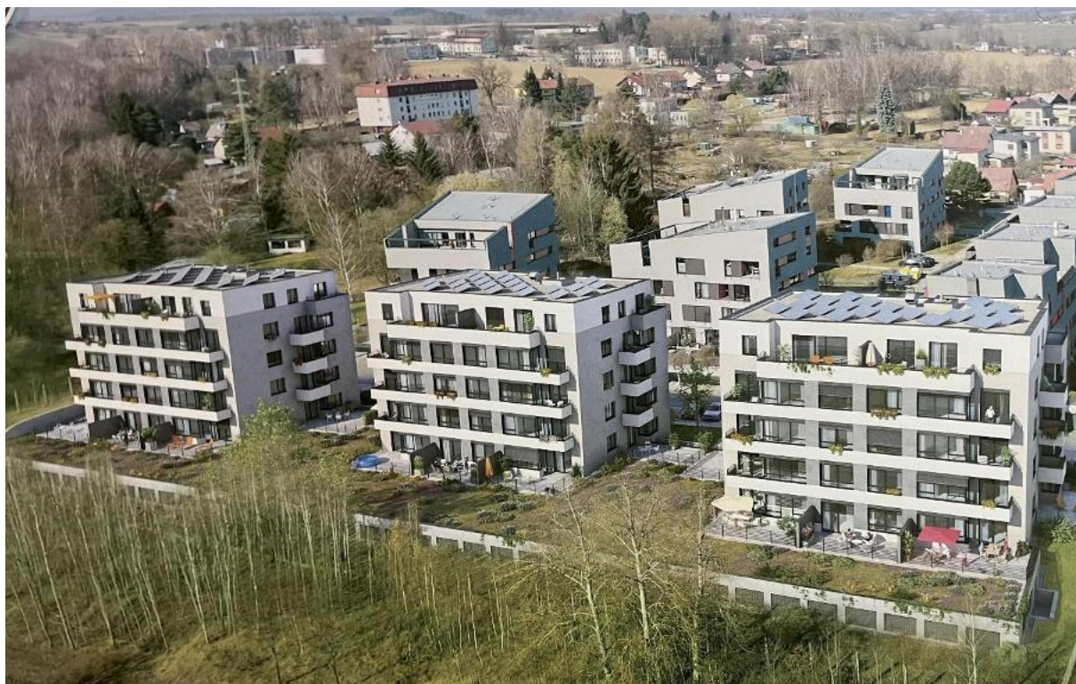
REZIDENCE ČECHOVKA – VIZUALIZACE

V současné době je hotový a obydlený dům „C“. V tomto měsíci je naplánovaná kolaudace domu „B“ a na jaře příští ho roku by měl jít do provozu poslední dům „A“.