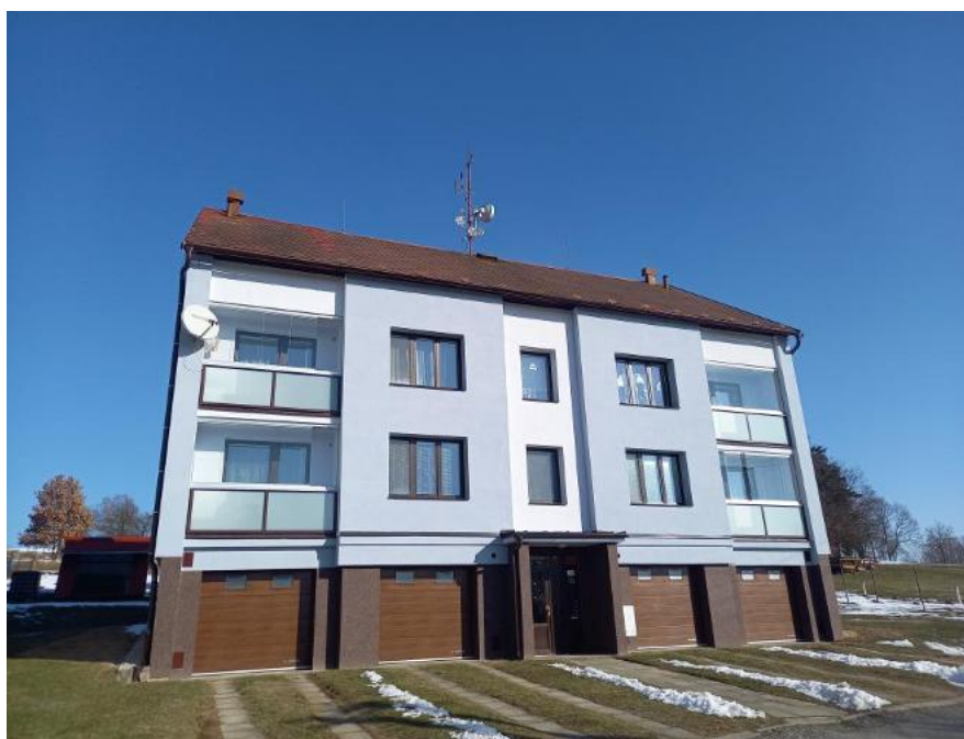
2022 - Olešná č.p. 88 – zateplení fasády