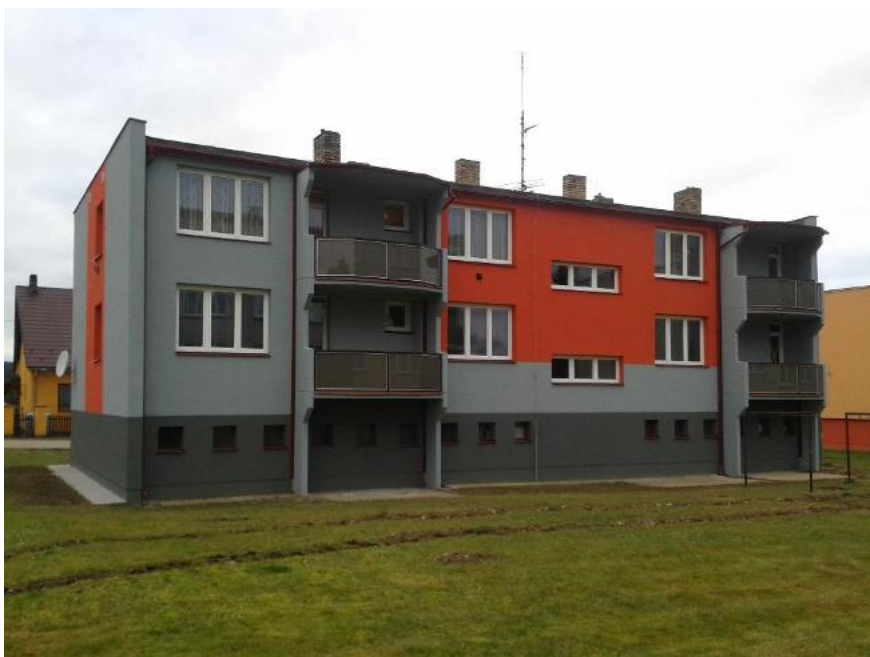
2014 - Obrataň č.p. 155 – přístavba lodžii, oprava fasády