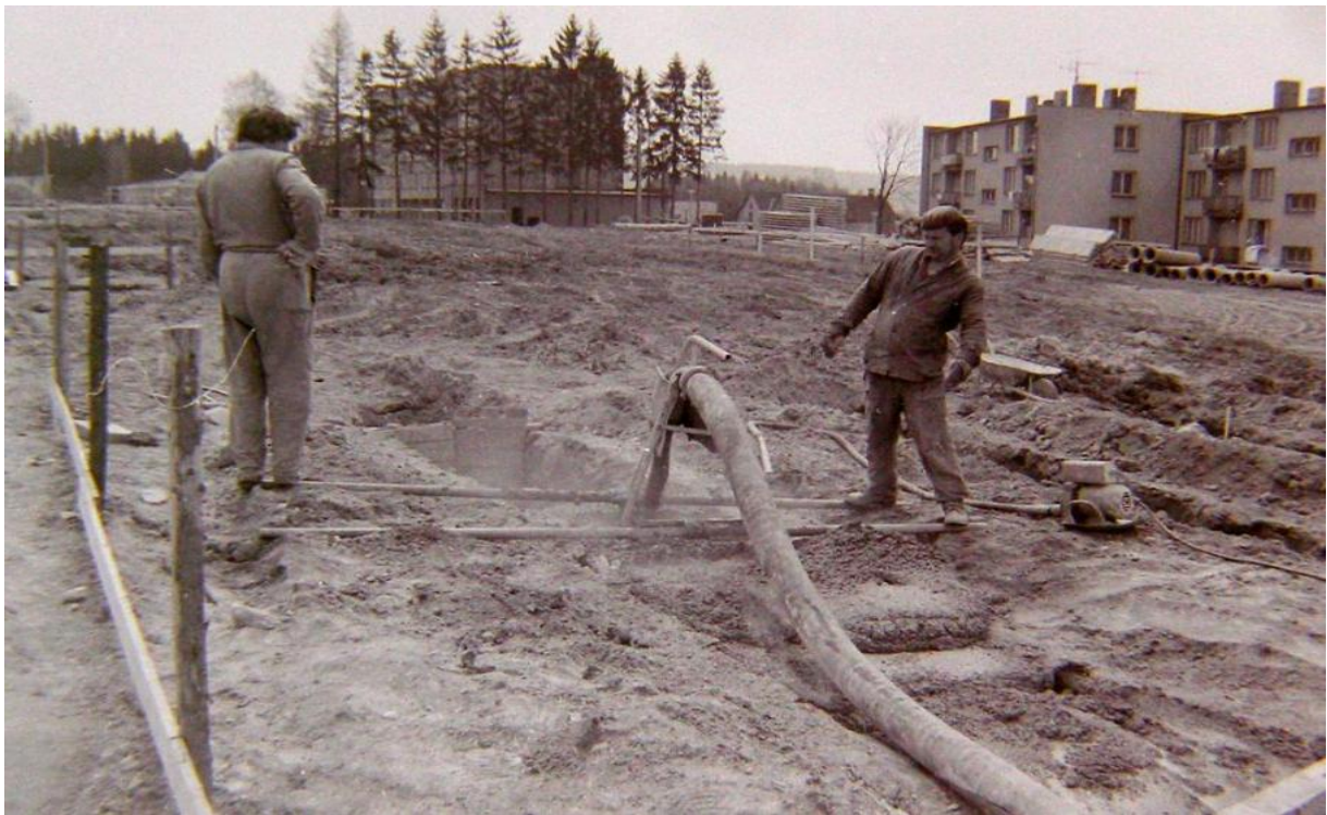
Foto z výstavby Sídliště Žirovnice