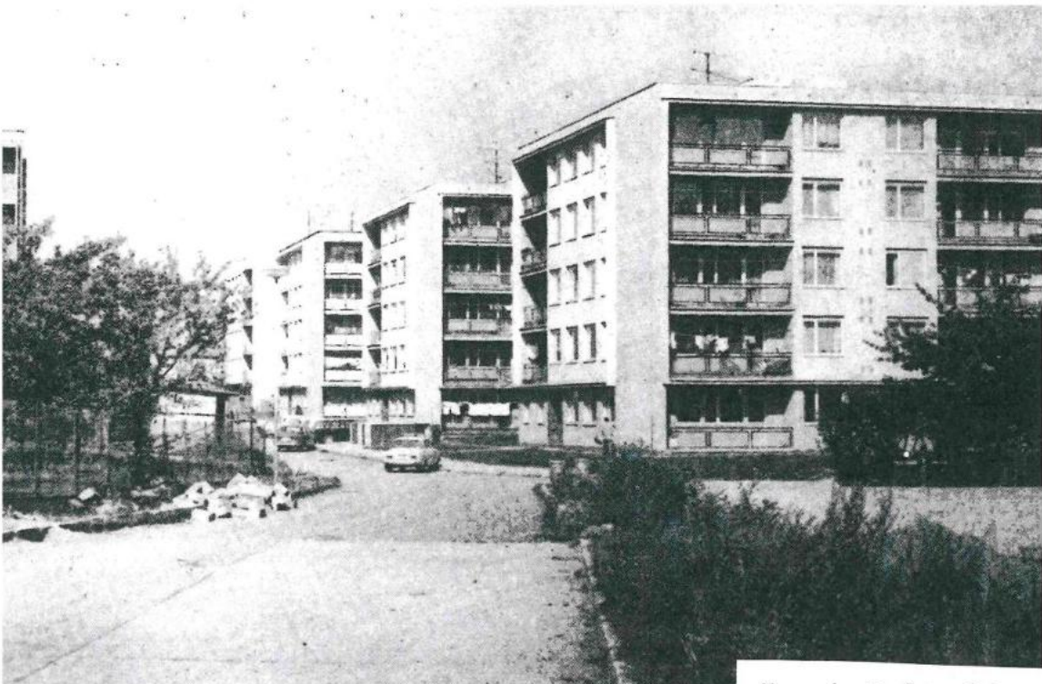
Humpolec, Družstevní ul.