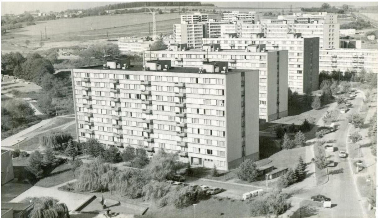
1985 – SÍDLIŠTĚ PRAŽSKÁ