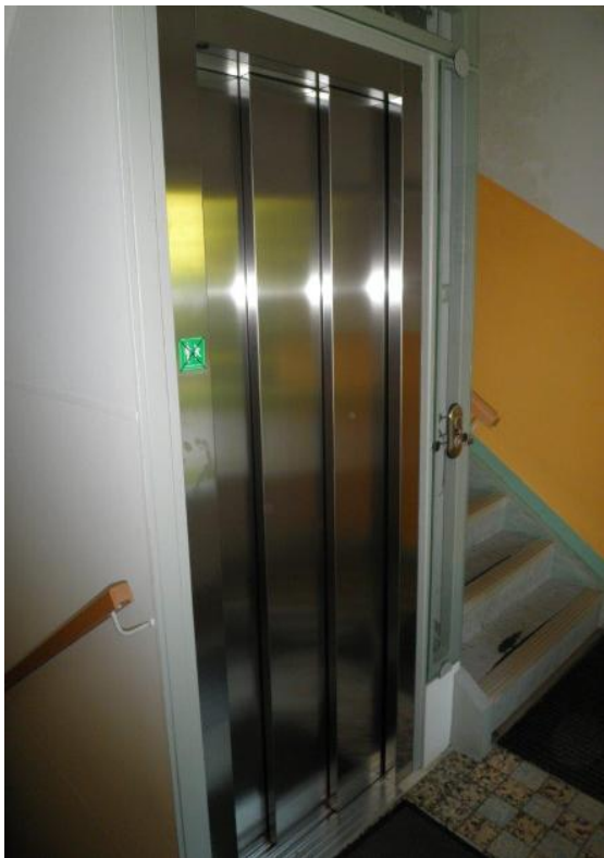
2012 - Pelhřimov, Sadová 1104-1107